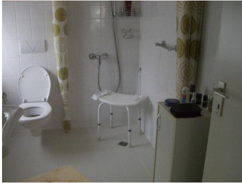
Duschhocker: ca. ab 30,- €