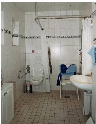
Badumbau komplett ca. ab 15.000,- €