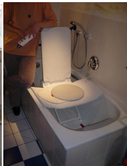
Wannenlift: ca. ab 250,- €