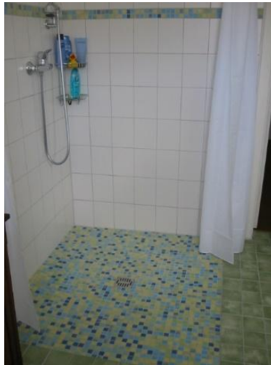
Bodengleiche Dusche statt Duschkabine: ca. ab 7.000,- €