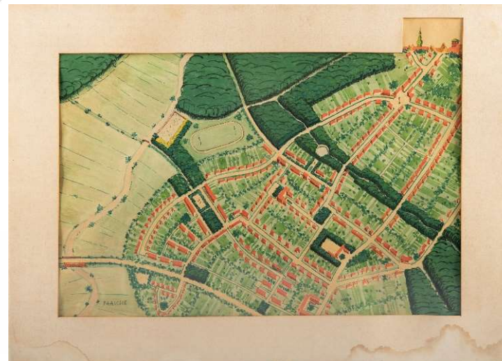
Städtebaulicher Rahmenplan zum Kopenkamp nach Paasche (Darstellung aus 1936)