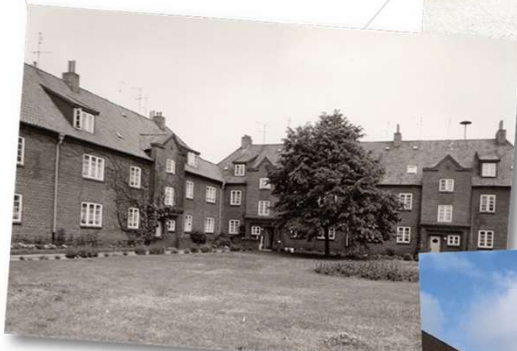
Thuner Straße 98 - 102