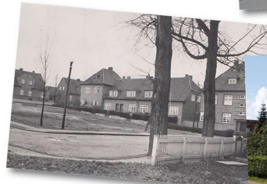
Teichstraße - Ecke Römerstraße