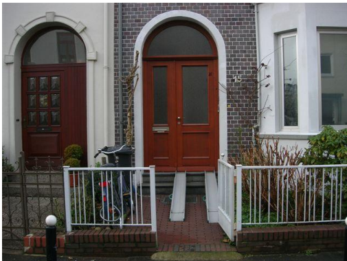
Kleine Rampe: ca. ab 150,- €