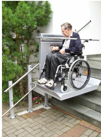
Plattformlift ca. ab 7.000,- €