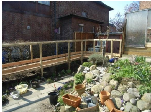
Große Rampe: ca. ab 5.000,- €