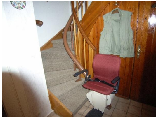
Treppenlift kurvig ca. ab 10.000,- €