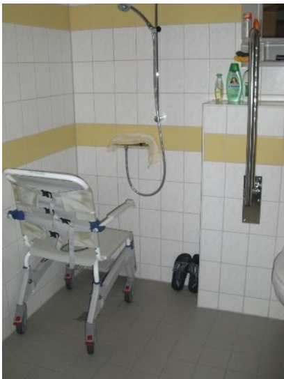
Duschrollstuhl: ca. ab 150,- €

Bei den folgenden Kostenbeispielen ist zu überprüfen, ob die teilweise sehr günstigen Produkte im Internet oder im Baumarkt auch eine gute Qualität haben.