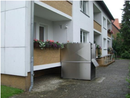
Außenhublift: ca. ab 5000,- €