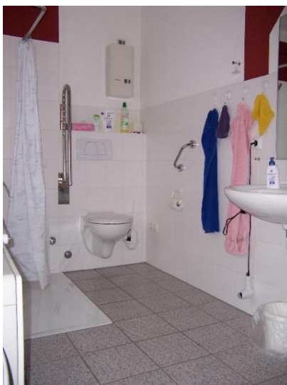
Einfacher Haltegriff: ca. ab 30 Euro