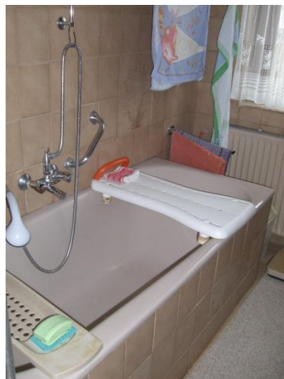
Badebrett: ca. ab 30,- €