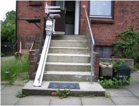
Treppenlift einfach: ca. ab 4.000,- €