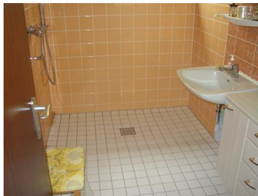
Bodengleiche Dusche statt Badewanne: ca. ab 7.000,- Euro